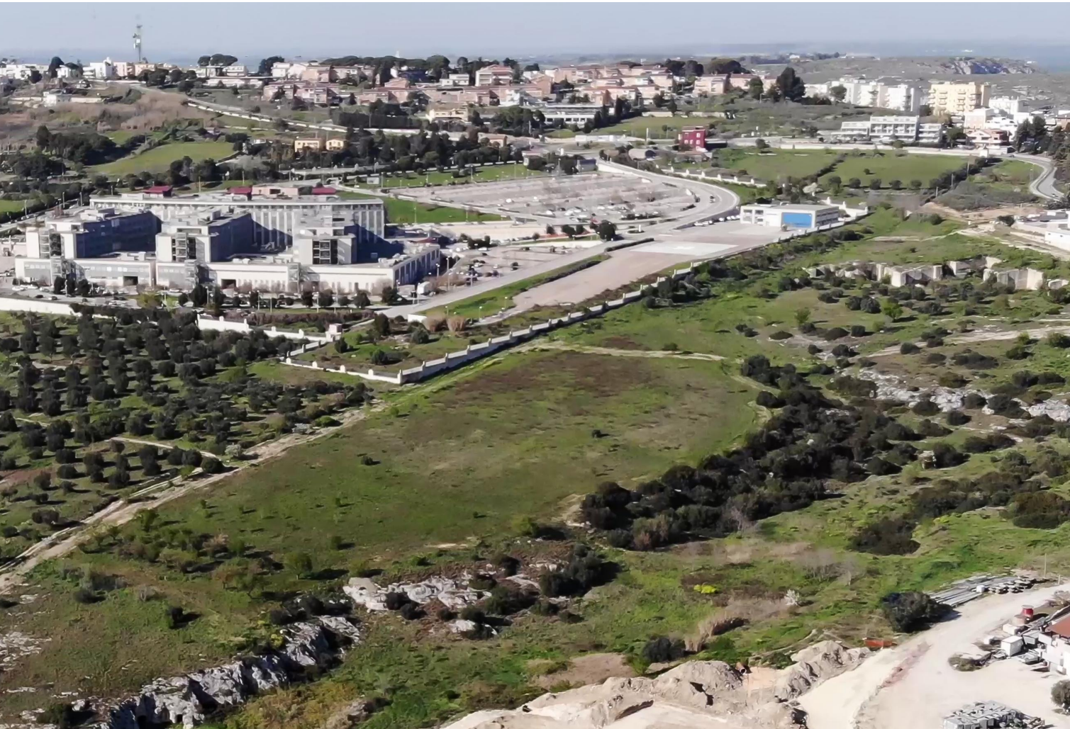
AREA DI INTERVENTO