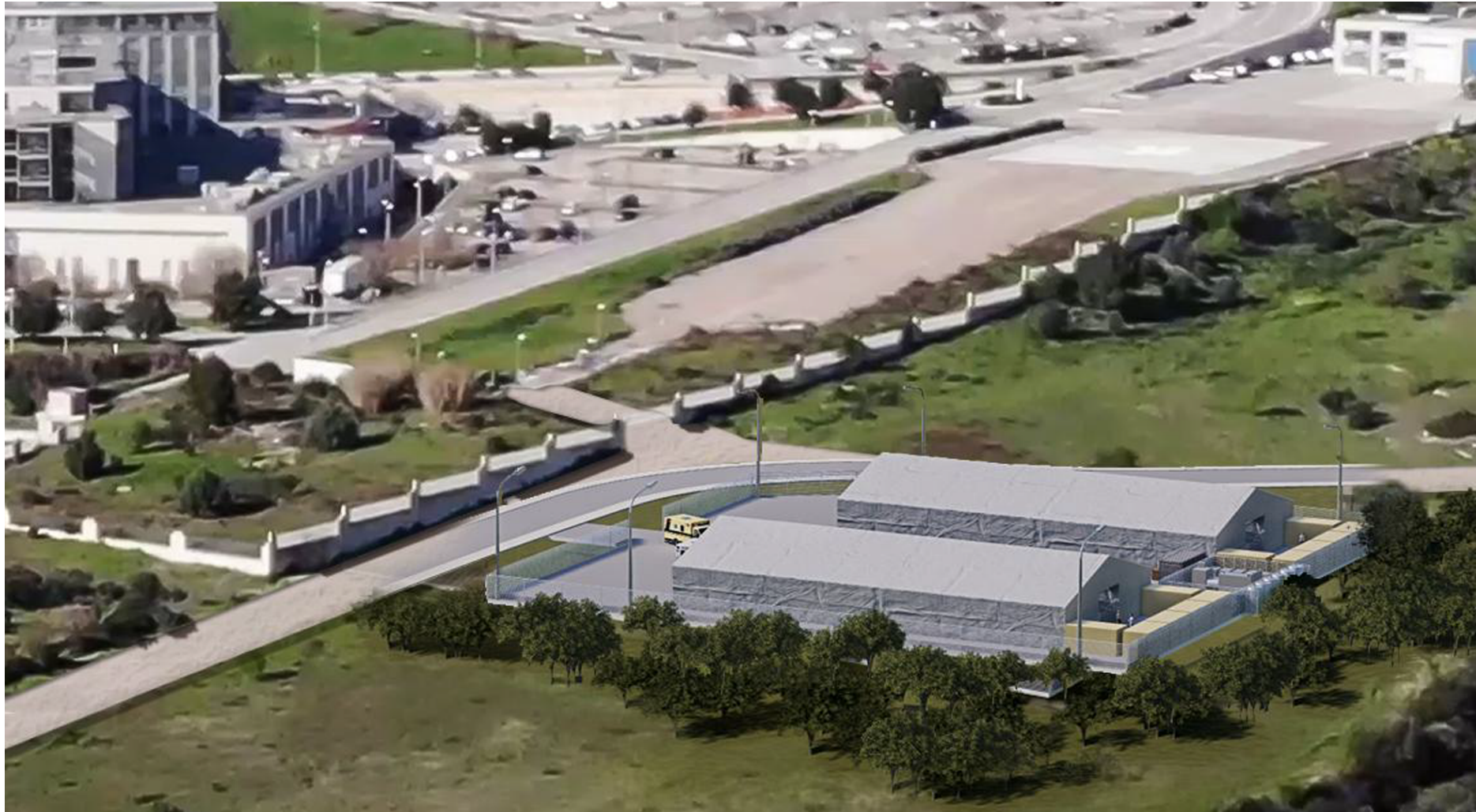
ZOOM VISTA VOLO D'UCCELLO

ASM AZIENDA SANITARIA MATERA U.O.C. ATTIVITA' TECNICHE E GESTIONE DEL PATRIMONIO