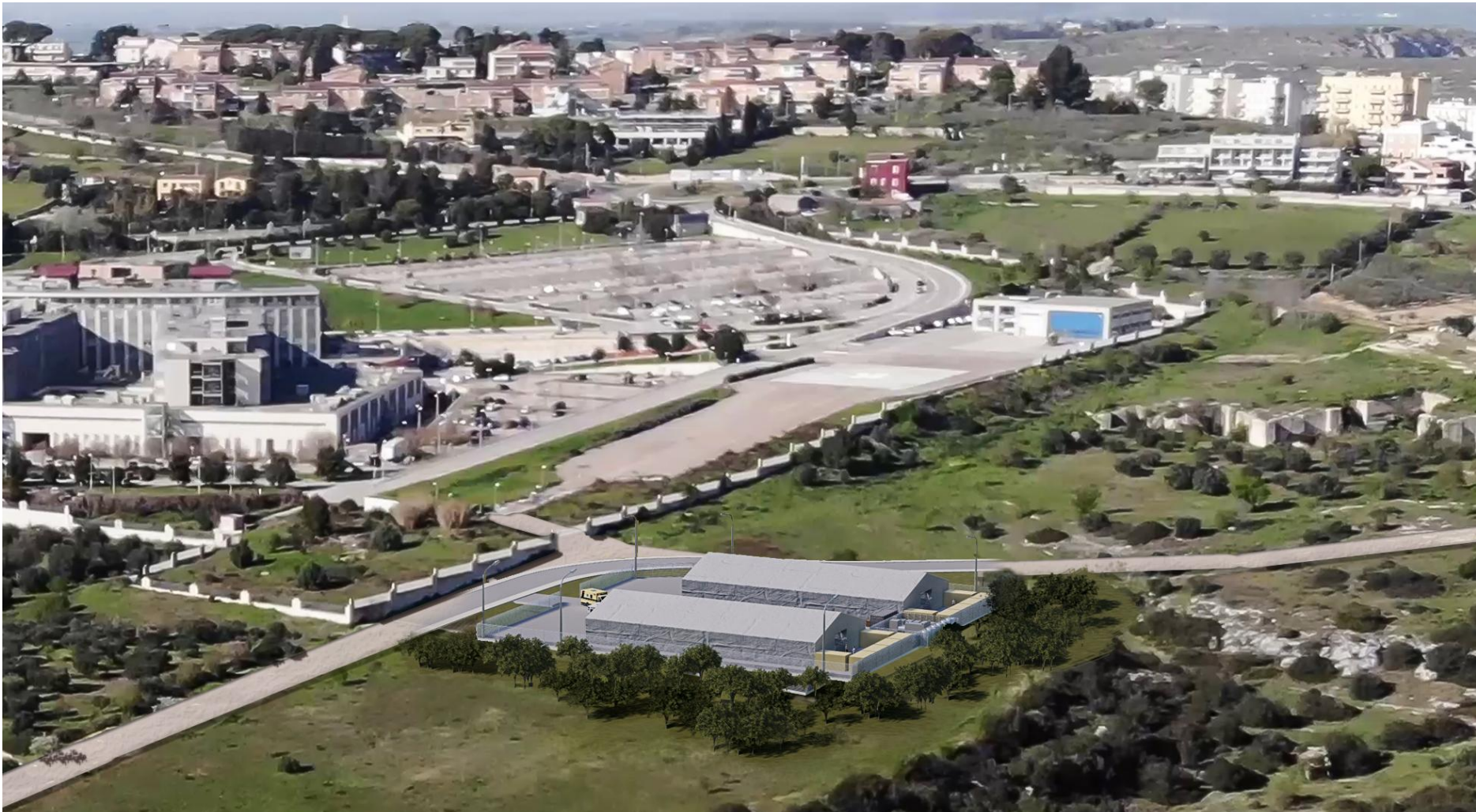
VISTA VOLO D'UCCELLO