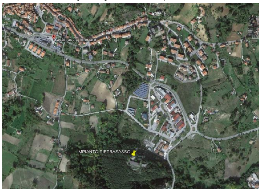
Fig. 1 Corografia Ubicazione Impianto

Nella stazione, realizzata negli anni '70 - '80, sono attualmente installate n. 4 elettropompe multistadio alimentate a 6000 V ed avviate da quadri tradizionali con parziale automazione. Le elettropompe, ormai vetuste, hanno rendimenti bassi, con conseguenziale diminuzione sia dei valori di portata sollevata che dell'efficienza, e ciò comporta anche un aumento dei consumi energetici specifici per mc di acqua sollevata.