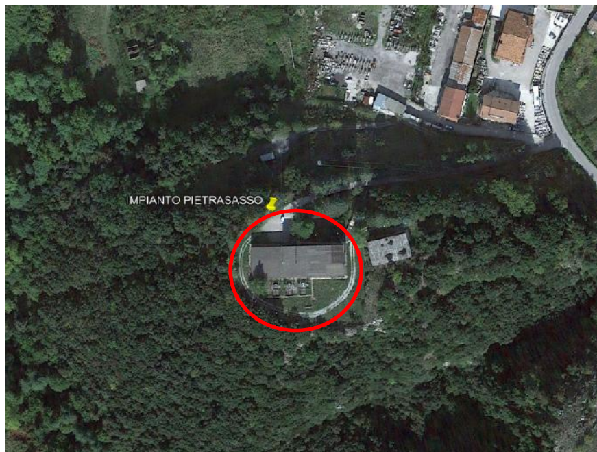
Fig. 2 Corografia Impianto – Individuazione Corpo d'Opera ove sono ubicate le macchine

Il seguente intervento relativo al I° stralcio risulta relativo al solo approvvigionamento delle nuove macchine ad alta efficienza, che dovranno essere consegnate, una volta prodotte e collaudate, presso il sito in questione.