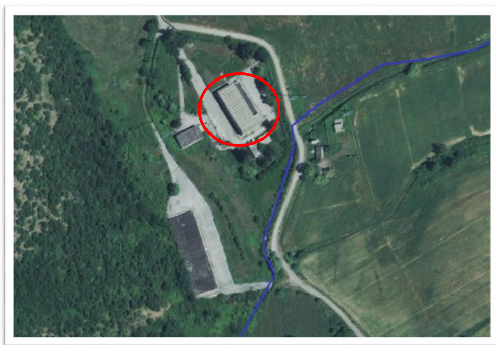
Fig. 2 Corografia Impianto – Individuazione Corpo d'Opera ove sono ubicate le macchine

Il seguente intervento relativo al I° stralcio risulta relativo al solo approvvigionamento delle nuove macchine ad alta efficienza, che dovranno essere consegnate, una volta prodotte e collaudate, presso il sito in questione.