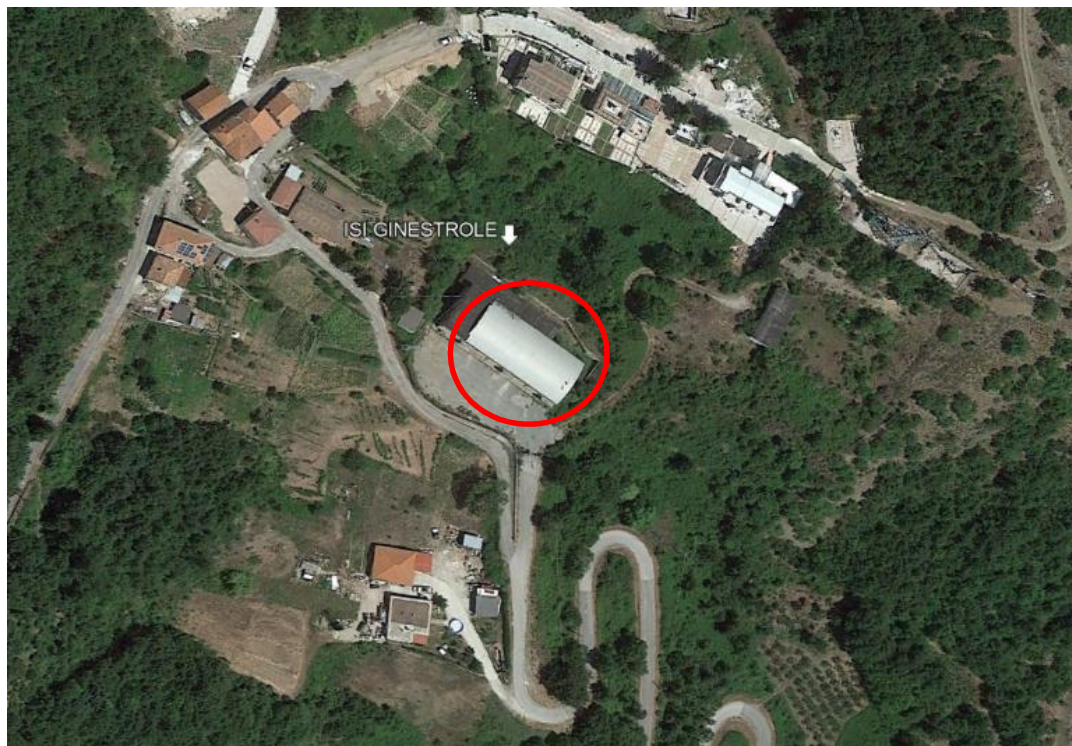
Fig. 2 Corografia Impianto – Individuazione Corpo d'Opera ove sono ubicate le macchine

Il seguente intervento relativo al I° stralcio risulta relativo al solo approvvigionamento delle nuove macchine ad alta efficienza, che dovranno essere consegnate, una volta prodotte e collaudate, presso il sito in questione.