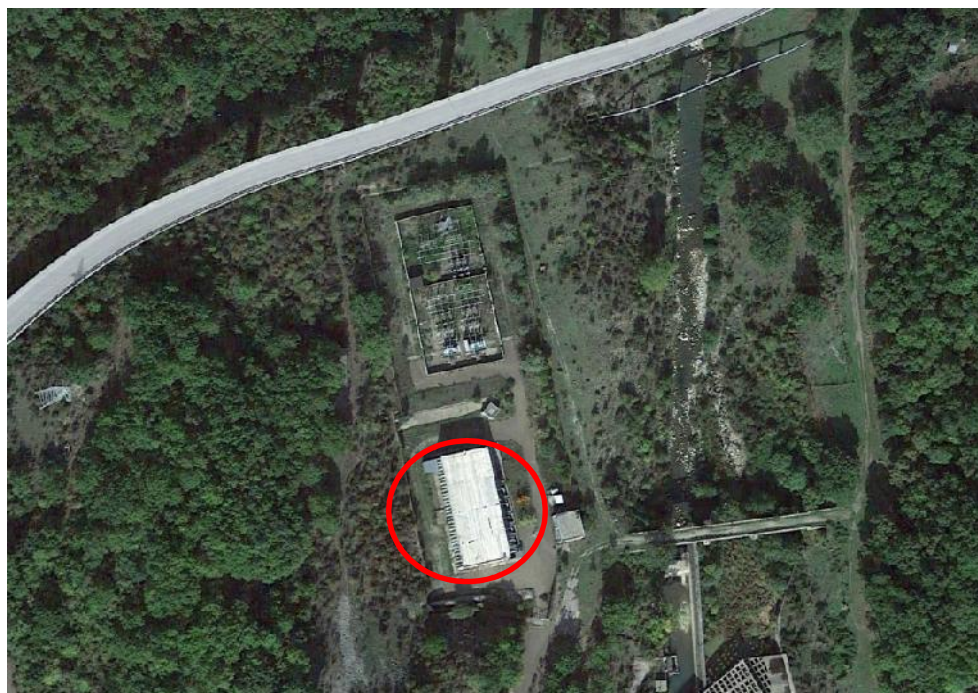
Fig. 2 Corografia Impianto – Individuazione Corpo d'Opera ove sono ubicate le macchine

Il seguente intervento relativo al I° stralcio risulta relativo al solo approvvigionamento delle nuove macchine ad alta efficienza, che dovranno essere consegnate, una volta prodotte e collaudate, presso il sito in questione.